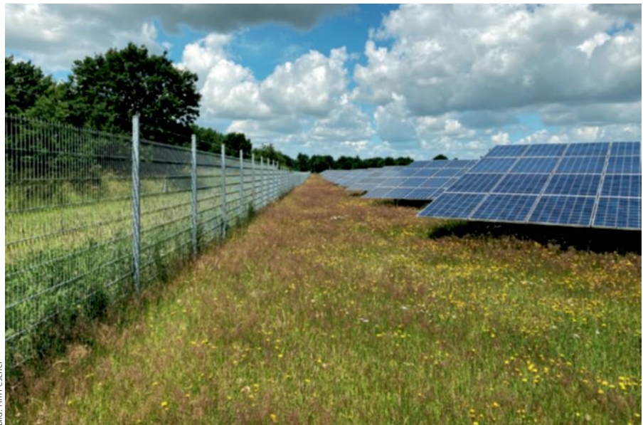
Abb. 2: Blütenreicher Magerrasen auf höher gelegenen Abschnitten mit Blühaspekt von Rauem Löwenzahn ( Leontodon hispidus )

Im Zuge der Rekultivierung ist in Teilen stark verdichteter und somit wasserstauer Boden (Angabe des Kiesabbauunternehmers am 24.08.2021) entstanden. In der Folge hat sich ein permanentes Flachgewässer entwickelt, das konstant fischfrei ist (Abb. 1). Hier ist der Laichplatz einer großen Teilpopulation der seltenen und streng geschützten Kreuzkröte ( Epidalea calamita ), die aufgrund der Bedingungen bis zu zwei Generationen pro Jahr entwickelt. Weiterhin finden sich stenotope Arten wie die Zitzen-Sumpfsimse ( Eleocharis mamillata ) und die Kleine Pechlibelle ( Ischnura pumilio ). Höher gelegene Be-