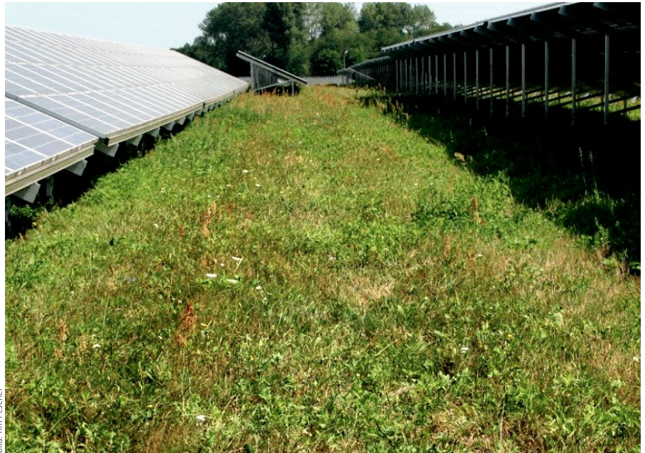
Abb. 7: Besonnter Streifen von mehr als 2,5 m Breite in einer Anlage bei Werneuchen um die Mittagszeit

In den Anlagen mit breiteren Reihenabständen wurde eine höhere Individuendichte festgestellt. Die Dichten lagen hier zwischen 1,6 und 2,7 Individuen/ha. In den Anlagenteilen mit geringeren Reihenabständen hingegen lagen die Dichten zwischen 0,3 und 1,0 Individuen/ha. Hierbei ist zu berücksichtigen, dass diese Zahlen den Besiedlungsstand anderthalb Jahre nach Fertigstellung der Anlage zeigen. Zudem wurden auf der gesamten Fläche des heutigen Parks für den Bau als Artenschutzmaßnahme alle Zauneidechsen vergrämt oder abgefangen. Deshalb ist davon auszugehen, dass inzwischen die Besiedlung weitaus dichter ist. Monitorings aus an-