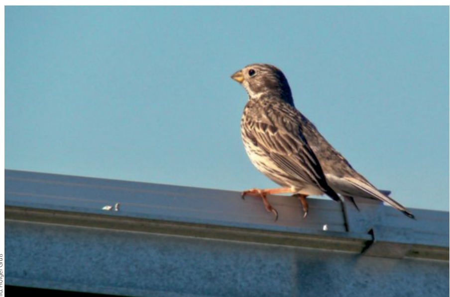
Abb. 3: Grauummer ( Emberiza calandra ) auf Solarmodul

Darüber hinaus es gibt weitere Arten, die sich diesen Lebensraum als Brutrevier erschließen (etwa Leguan GmbH 2014, Möller & Reichling 2015). Regelmäßig kommen bei-